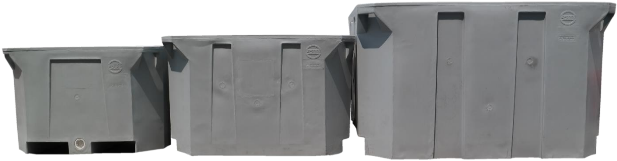
从左到右： 300L, 500L 和 1000L