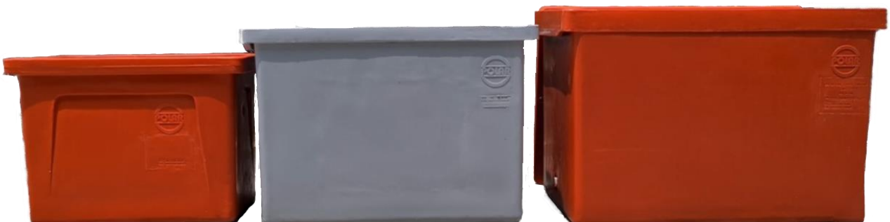
从左到右： 60L, 120L 和 200L